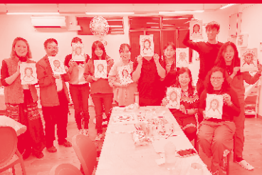
崇基神學院靜修營：「瞻仰他的聖容」 Page 15