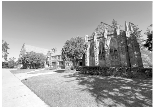
其中一間 GTU 會員學院 Pacific School of Religion，其中一間美國最早期關注邊緣群體及社群牧養的神學院，設有聖經考古的展品 (Bade Museum)。

GTU 以外，在加州灣區，除了可接觸本地教會，認識各種宗派傳統外，也有很多機會到訪大小博物館、藝術館及參與導覽活動。美國的博物館及藝術館設計非常用心，我閒時也會走走幾趟，對文化、歷史、宗教也很有啟發。例如我曾參與史丹福大學的歷史導覽，一聽史丹福大學及史丹福家族的歷史，他們與政商界和移民華人的關係，以及辦學理念等。然而，灣區治安不佳，偶然便會收到一些罪案的消息。街上有不少無家者，雖大多都很友善、也是社區一分子，但卻反映社會不景氣。每當與他們相遇，我也反省當今的信仰和靈性該怎樣在社群實踐。