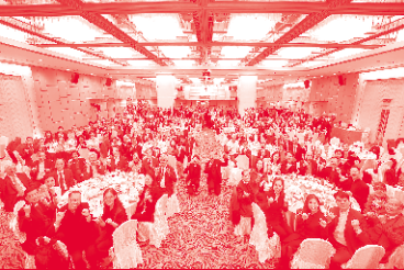
六十周年院慶感恩晚宴 Page 06