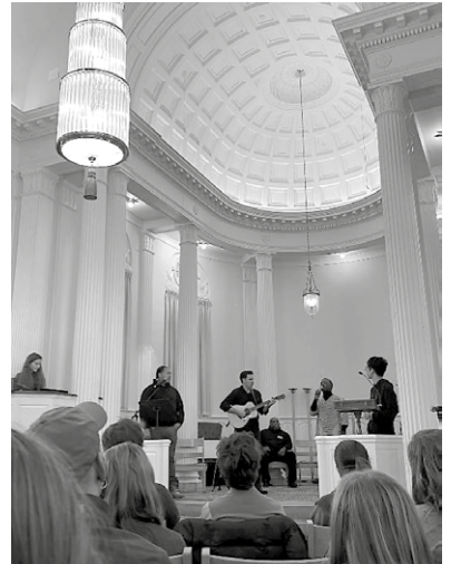
課堂 Gospel, Rap, Social Justice: Prison & Art 結業分享演出照片。(筆者在台上右一)

達信仰的特點。我以自編的獨舞演繹約翰福音 14 章 15–21 節，幫助會眾進入默想，老師則在默想後以另一只自創舞蹈作回應。透過會眾的反應和回饋，我發現自己編舞風格更傾向演繹一個故事和情緒狀態，帮助大家以觀看來進入反思，老師的舞蹈風格則更著重帶動會眾的情感回應，會眾在過程會忍不住站立、拍掌、唱和，卻感覺完全不是在騷擾，而是舞者和會眾在互動，共創對上主的獻呈。這次經歷讓我發揮所長，同時更深入與美國師生作藝術服侍的交流，擴闊我對舞蹈以至藝術事奉的眼光。