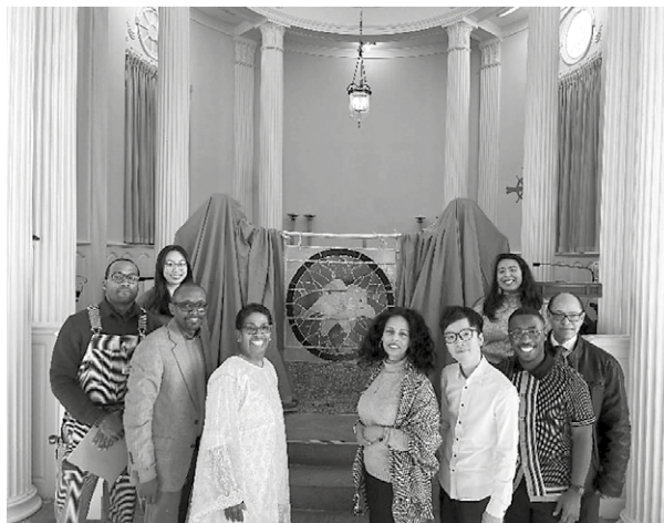
11 月底藝術崇拜 "Life's Lilies": A Service of Art, Dance, and Prayer 事奉人員合照。(筆者在第一排右三)

「發揮」是運用自己的恩賜，讓我與當地師生可以有更深的交流。當耶魯神學院的崇拜同工知道我有舞蹈事奉的背景，他們邀請我與一位禮儀舞 (Liturgical Dance) 的老師合作，加上幾位同學的配搭，一同在 11 月完成一次藝術崇拜。我參與崇拜的禮序設計、主題討論等部分，更多樣地學習如何在崇拜中加入藝術元素，同時我以舞蹈更深地投入是次服侍，使我在過程發現自己以舞蹈表