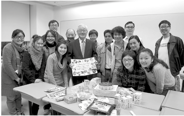
和徐教授的相遇和討論令 Jadesmon 印象深刻。