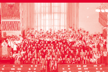
六十周年院慶感恩崇拜暨 2023神學日 Page 11