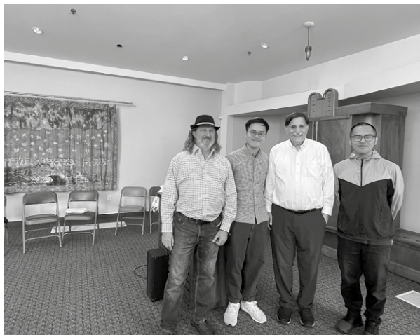
改革派猶太教的室友（左一）帶我及另一同學（右一）到 GTU 附近的猶太會堂聚會，當天更被拉比（右二）邀請協助重新卷起羊皮希伯來聖經卷軸的禮儀。

另外，灣區有很多華人群體來自不同的世代和地方，彼此背景不同卻又聚集一起。透過 GTU 有關的中國機構，我認識海外華人教會歷史，以及灣區早期亞洲移民歷史，對亞洲神學和教會歷史，多了一手的見聞。香港人的身分，也讓我可分享香港的狀況給不少對香港關注的師生。